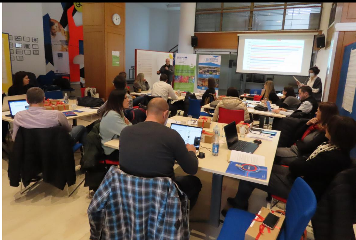
Validacija akcijskog plana. (Fotografija: